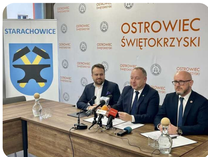
Na początek były ankiety

- Chcemy by tych spotkań było jak najwięcej i ich zadaniem będzie nie tylko zdobywanie kontaktów, ale również wiedzy oraz praktycznych informacji, które będą służyć wszystkim przedsiębiorcom - dodał Prezydent Matek.